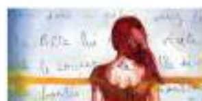
Gabrielle Tuloup Sauf que c'étaient des enfants